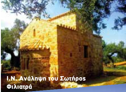
Ι.Ν. Ανάληψη του Σωτήρος Φιλιατρά