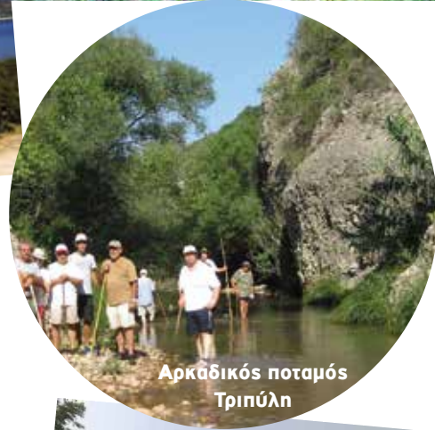
Αρκαδικός ποταμός Τριπύλη