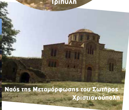
Ναός της Μεταμόρφωσης του Σωτήρος Χριστιανούπολη