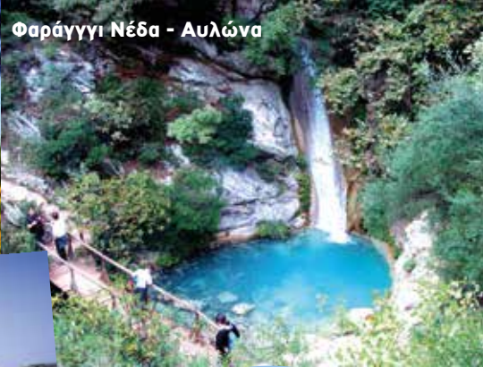
Φαράγγι Νέδα - Αυλώνα