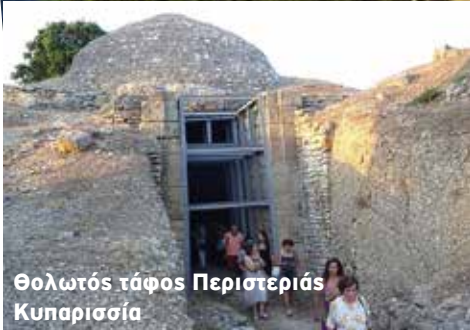
Θολωτός τάφος Περιστεριás Κυπαρισσία