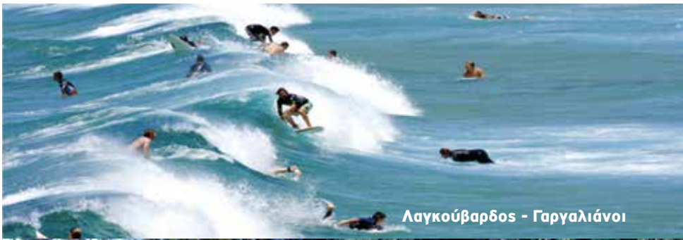
Λαγκούβαρδος - Γαργαλιάνοι