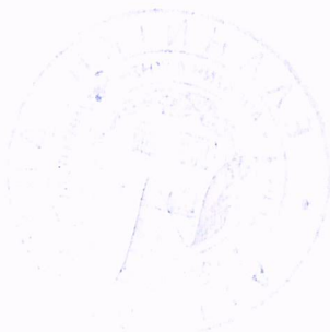
Σπυρίδων Λαμπρόπουλος Π.Ε. Περιφερειακής Ανάπτυξης

ΑΚΡΙΒΕΣ ΑΝΤΙΓΡΑΦΟ ΑΠΟΚΕΝΤΡΩΜΕΝΗ ΔΙΟΙΚΗΣΗ ΠΕΛ/ΝΗΣΟΥ ΔΥΤΙΚΗΣ ΕΛΛΑΔΑΣ & ΙΟΝΙΟΥ Ε. ΕΠ. ΕΤ.