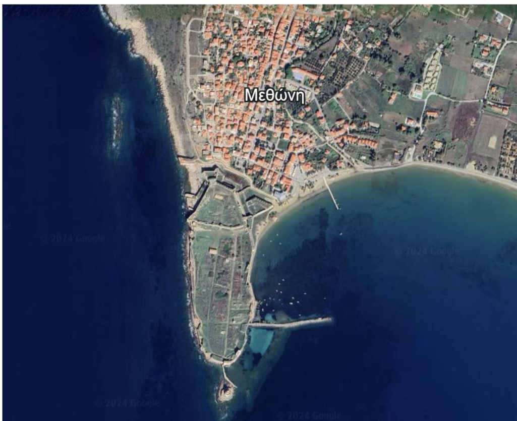
Άποψη Λιμένα Μεθώνης

Τα ΤΟΠΟΓΡΑΦΙΚΑ ΔΙΑΓΡΑΜΜΑΤΑ για τον καθορισμό των ΧΕΡΣΑΙΩΝ ΖΩΝΩΝ της ΚΥΠΑΡΙΣΣΙΑΣ, ΜΑΡΑΘΟΠΟΛΗΣ ΚΑΙ ΜΕΘΩΝΗΣ, έχουν δημοσιευτεί στα ΦΕΚ : 300/27-7-2010 (ΤΕΥΧΟΣ Αναγκ. Απαλλοτριώσεων ΚΑΙ Πολεοδομικών Θεμάτων) 59/1-3-2013 (ΤΕΥΧΟΣ Αναγκ. Απαλλοτριώσεων ΚΑΙ Πολεοδομικών Θεμάτων) και ΦΕΚ Δ'295/1972 αντίστοιχα.